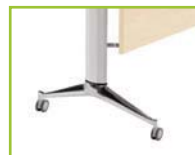
Die-casted aluminium, chrome finish with castor