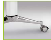
Die-casted aluminium, chrome finish with castor