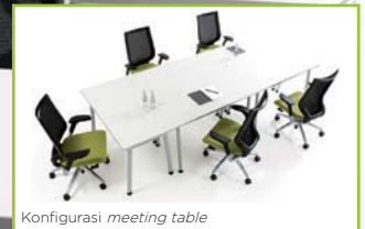
Konfigurasi meeting table