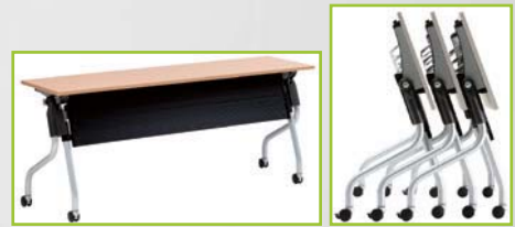
T-0 Desk/Folding + Castor/140W x 60D Ref. No. T0/14060 T-0 Desk/Folding + Castor/180W x 60D Ref. No. T0/18060

Suatu sistem meja rapat modular dengan desain simpel yang dapat diaplikasikan untuk beragam keperluan, seperti meeting room , training room , classroom . Dilengkapi castor/roda untuk memudahkan dalam rekonfigurasi/ re-layout . Aksesori fungsional seperti modesty panel dan screen tersedia untuk melengkapi fungsi meja tersebut.