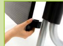
Modesty panel (optional)