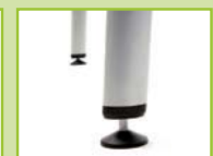
Height adjustable glide