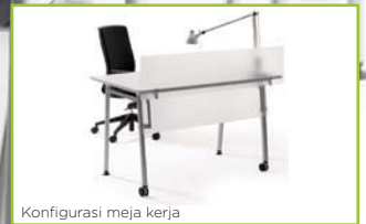
Konfigurasi meja kerja