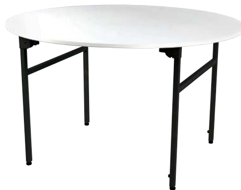
Srikandi Folding Desk Dimensi: 1500D x 730H (mm)

Ref. No. FD-15060 Rectangular Folding Desk