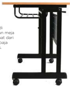
Roda yang dapat dikunci.

Rak buku di bawah daun meja yang terbuat dari batangan baja berkualitas.