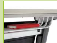
Wiring basket (optional)