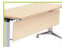
Wood modesty panel